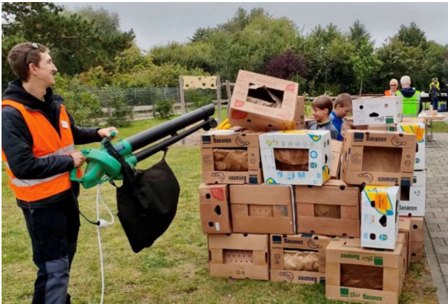
Sturmfest? – „Kirche Kunterbunt“ in Neu Wulmstorf