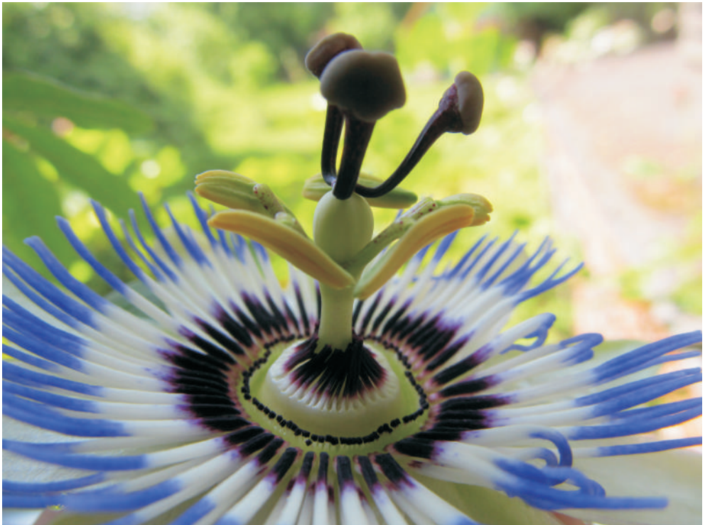
Blaue Passionsblume– Passiflora caerulea

Infobrief der Landeskirchlichen Gemeinschaften im Raum Winsen (Luhe)