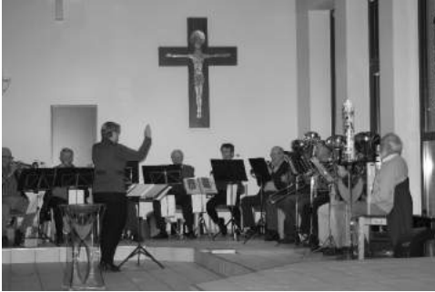
Posaunenchöre Brackel und Ohlendorf