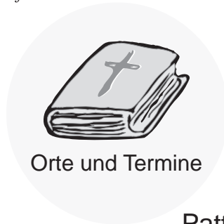
Orte und Termine

Teenkreis montags 18.30 Uhr EC-Jungschar mittwochs 18.00 Uhr