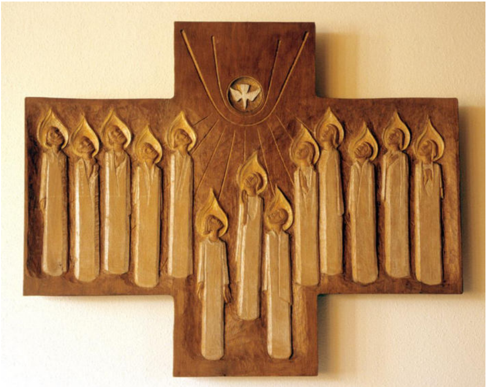
Pfingstkreuz von Karl Hemmeter im Andachtsraum der Evangelischen Missionsschule Unterweissach

Infobrief der Landeskirchlichen Gemeinschaften im Raum Winsen (Luhe)