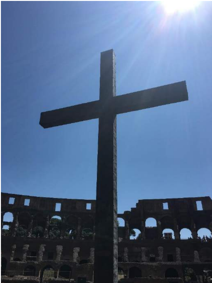
Rom, Colosseum

Infobrief der Landeskirchlichen Gemeinschaften im Raum Winsen (Luhe)