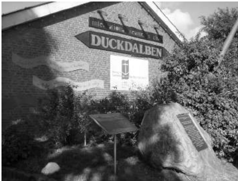
Die Seemannsmission Duckdalben