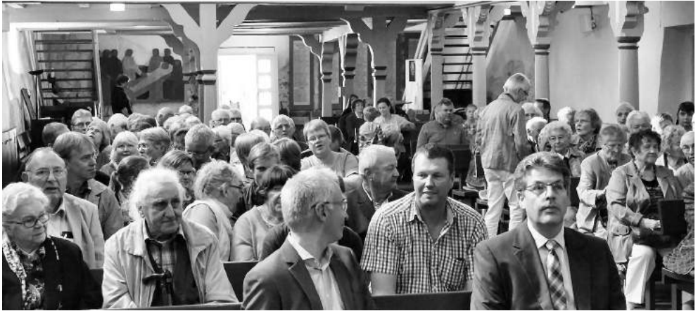
Ankommen in der Pattensener St. Gertrud-Kirche

schaftsverbandes mit Sitz in Kassel berufen. Über den erlernten Beruf als Großhandelskaufmann und Nutzfahrzeugverkäufer und einem Studium am theologischen Seminar St. Chrischona (Schweiz) und Leiter eines großen christlichen Verlages kam er in dieses Amt. Er ist heute 47 Jahre alt, verheiratet und hat zwei Kinder.