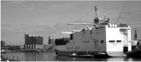
Hafen mit Elbphilharmonie