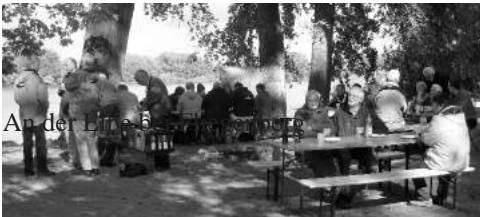
An der Elbe bei Fliegenberg